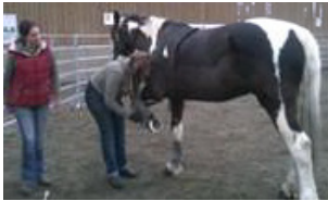
Comportement du cheval

Le service propose des formations clé en main, ou alors il est possible de monter des modules spécifiques sur mesure.