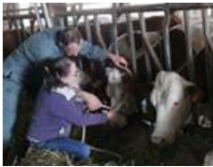
Contention de bovins