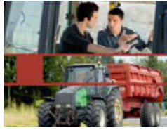
Conduite d'engins agricoles